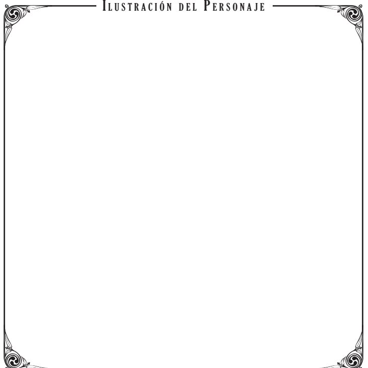
ILUSTRACIÓN DEL PERSONAJE